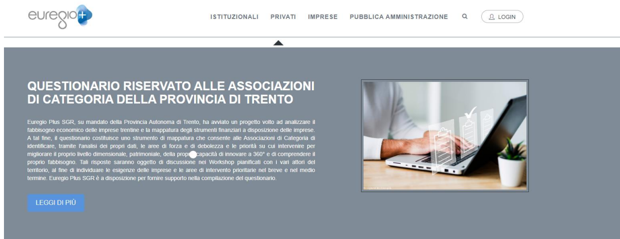
Figura 1. Schermata del sito

Per accedere al questionario, è sufficiente digitare l'URL https://www.euregioplus.com/it/homepage nella barra degli indirizzi del browser. Nel quadro in basso comparirà la finestra con una breve descrizione del Questionario riservato alle Associazioni di Categoria della Provincia di Trento nel quale cliccare su "Leggi di più" per accedere direttamente sulla pagina: