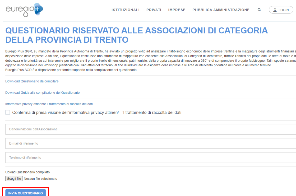
Figura 6. Schermata del sito

Una volta compilato, il file Excel dovrà essere caricato sulla piattaforma Euregio Plus SGR seguendo il link precedente https://www.euregioplus.com/it . Compilare i campi sulla denominazione dell'associazione di categoria, l'email e il telefono di riferimento. Presa visione dell'informativa privacy attinente il trattamento di raccolta dati, caricare il file compilato cliccando su "Scegli file" e infine, premere "INVIA QUESTIONARIO" per completare l'operazione.